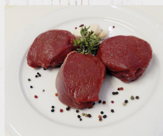
Hirsch - Rückensteak Österreich

1 x 2,5 kg/VE Art.Nr. A10287; VE 29,23 € per kg: 11,69 €