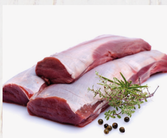
Hirschkalbsrücken ohne Knochen, Spanien

ca. 0,6 - 1,2 kg/VE Art.Nr. A7872 per kg: 31,59 €