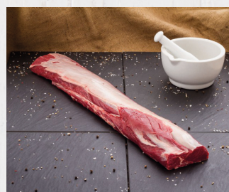
Hirschrücken ohne Knochen, Spanien

ca. 0,6 - 1,2 kg/VE Art.Nr. A7872 per kg: 31,59 €