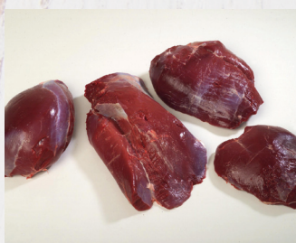
Hirschkeule 4er Schnitt 1 Set/VE, Spanien

ca. 2 kg/VE Art.Nr. A82109 per kg: 23,19 €