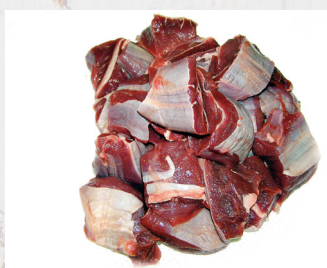
Hirschgulasch Schenkel, Österreich

ca. 8 kg/VE Art.Nr. A10386 per kg: 13,69 €