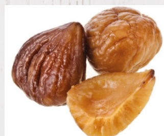
Maroni ganz 180/200 1 x 1 kg/VE Art.Nr. A9461; VE 7,29 € per kg: 7,29 €