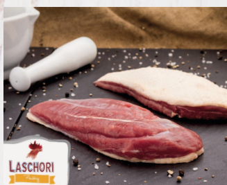
Entenbrust, Barbarie weiblich, Frankreich 170 - 230 g 1 x 5 kg/VE Art.Nr. A10288; VE 70,95 € per kg: 14,19 €