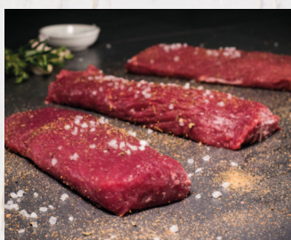
Mufflon Rücken ohne Knochen, Spanien

ca. 1 kg/VE Art.Nr. A82245 per kg: 15,89 €