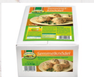
BL Semmelknödel ca. 150 g/Stk. 1 x 3,75 kg/VE Art.Nr. FF20181; VE 16,76 € per kg: 4,47 €