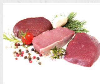
3-erlei vom Wild Hirsch-, Rehmedaillon & Wildschweinsteak, Österreich 16 Stk. à ca. 180 g/VE Art.Nr. A10259; VE 86,24 € per Stk.: 5,39 €

ca. 1 kg/VE Art.Nr. A82245 per kg: 15,89 €